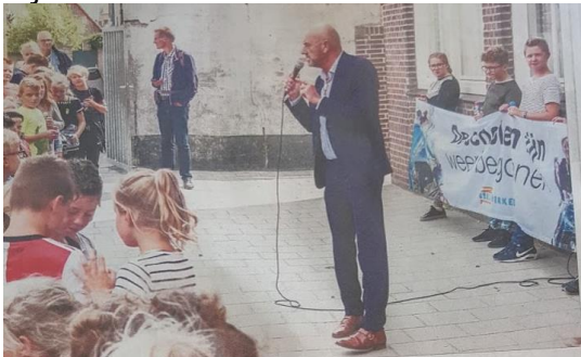
Rechtstreeks luisteren de kinderen naar de wethouder

Maandag was wethouder Nagtegaal en een legertje pers op school om de plaatselijke aftrap van de actie letterlijk door te kinderen leven in te blazen.